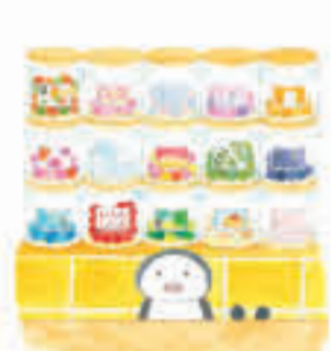
「ゆめぎんこう」白泉社 2020年 ©aki kondo

休 日 6月2日(日)まで 10時から16時 旭ヶ丘10-16-67 0572-278038 月・火曜(祝日は開館) 一般700円、小中高生200円 未就学児 無料