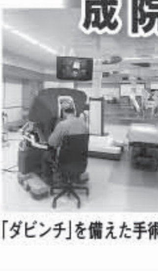
「ダビンチ」を備えた手術室

県立多治見病院前(畑町)の新しい中央診療棟が、4月30日から稼働します。総合受付には安藤工さんの巨大な陶壁、内装は主に多治見産のタイルが使用され、東濃檜や美濃和紙など県産の材料が用いられています。大きな特徴は手術室を8から11室に増設し、手術支援ロボット「ダビンチ」を導入。また、血管内治療と外科的手術を同時に実行できる。旧棟は539の病室になり、駐車場になる予定です。(安)