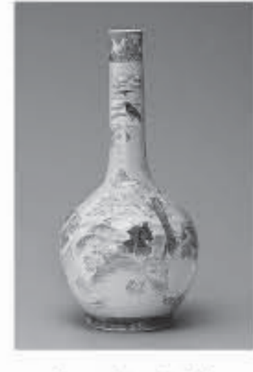
五代西浦園治 (上絵金彩染付四季図大長頸壺) 19世紀後期 H85.8cm

大きなから、やきものを解剖する うつわの犬中小展 県現代陶芸美術館では、館所蔵の近現代陶磁器コレクションから、日本で作られた陶磁器によるさまざまな作品を紹介する展覧会を開催しています。 うつわは、それぞれの用途に応じてその大きさが決まっています。飲食にかかわる抹茶わん、洋食器、漬物壺 見栄えのよい大きな飾皿・飾壺も存在します。 本展では、「うつわ」たちを、「大きさ」という観点から読み解き紹介します。