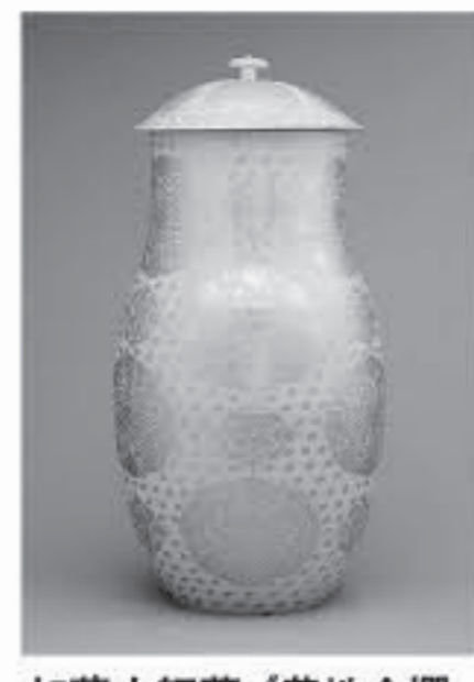
加藤土師 萌 (黄地金襴手菊文蓋付大飾壺) 1968年 H150.0cm

大きなから、やきものを解剖する うつわの犬中小展 県現代陶芸美術館では、館所蔵の近現代陶磁器コレクションから、日本で作られた陶磁器によるさまざまな作品を紹介する展覧会を開催しています。 うつわは、それぞれの用途に応じてその大きさが決まっています。飲食にかかわる抹茶わん、洋食器、漬物壺 見栄えのよい大きな飾皿・飾壺も存在します。 本展では、「うつわ」たちを、「大きさ」という観点から読み解き紹介します。