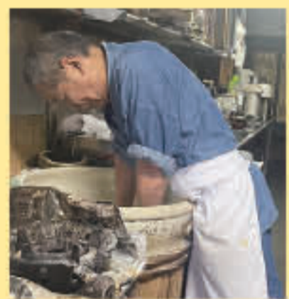
腕にはサポーター。「ありがたいうか、仕事に差し支えるほど痛くない」

住 上野町3-46 電 0572(22)1984 営 木・全・土曜のみ 駐車場は店横4台、他10台